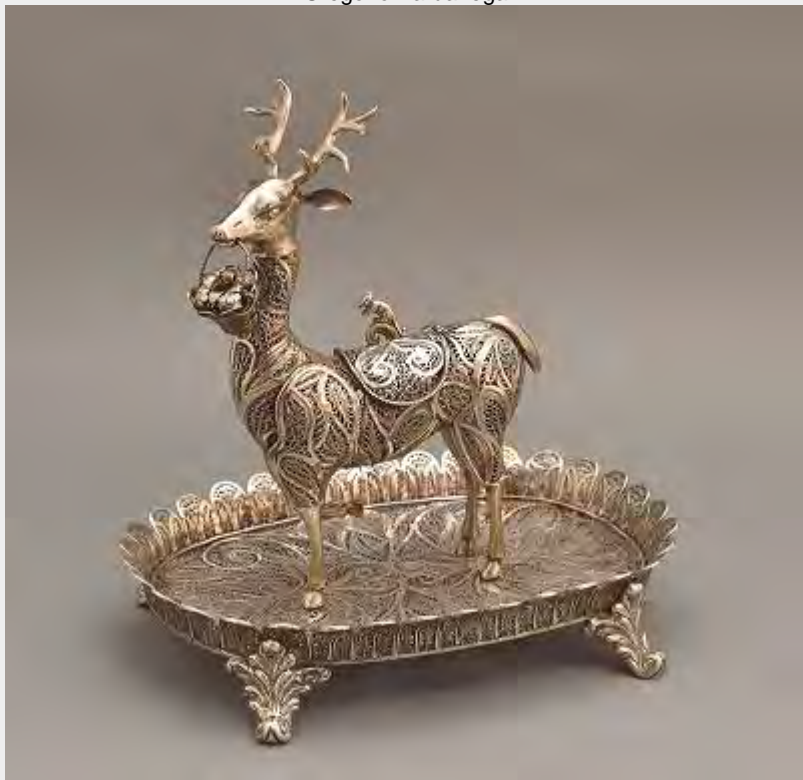
Sahumador de Filigrana Alto Perú del 1800