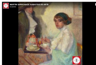
Exposición 5 al 10 de Abril Subasta 11, 12, 15 y 16 de Abril Lote 75 - Ver más

La subasta de abril - el catálogo completo se puede consultar aquí - contará con cuadros de grandes maestros ya comunes en este tipo de ventas como Benito Quinquela Martín, Raquel Forner, Antonio Berni, Rogelio Polesello, Carlos Ripamonte, Juan Carlos Castagnino, Pío Collivadino, Fortunato Lacamera, Juan Carlos Castagnino, Carlos Alonso, Raúl Soldi, Antonio Seguí, Emilio Pettoruti, Lino Eneas Spilimbergo, Cándido López, Pérez Celis, entre decenas de otros.