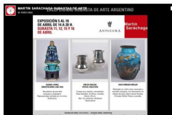
Los invitamos a la excepcional Exposición, que se inaugura este 5 de Abril de 14 a 20 hs, de Arte Argentino. Las Subastas se realizarán el 11, 12, 15 y 16 de Abril.

El 80% de todo lo ofrecido en subasta vinculado a arte oriental encuentra dueño, indica Saráchaga. En ocasiones la puja entre ellos hace saltar los precios como sucedió en 2011 con un plato de porcelana que, con un precio de base de 1000 dólares, se vendió por 46.000.